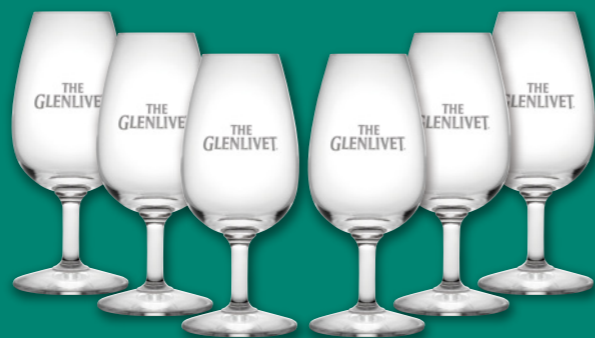
●テイスティンググラス 6脚