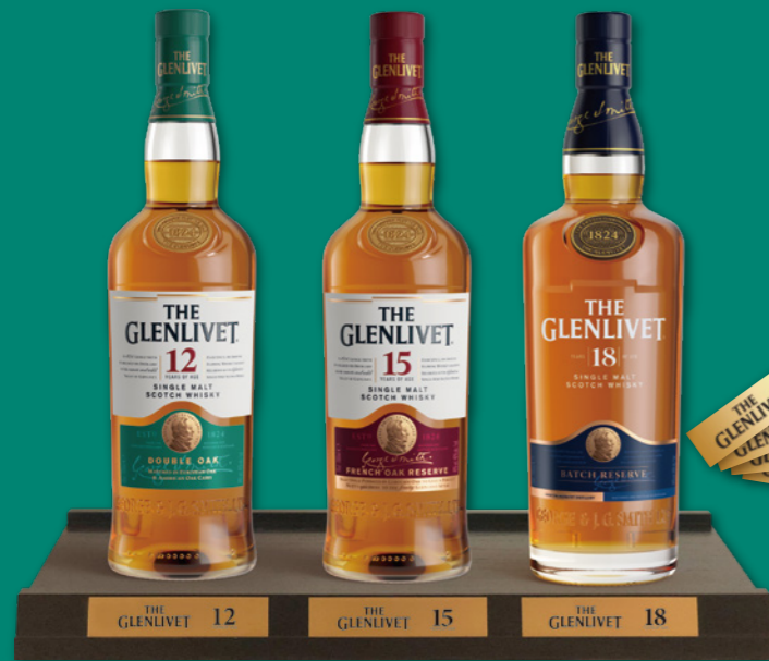
●ボトルディスプレイ(プレート付き)1台